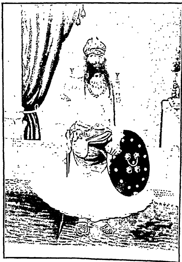
स्व० महाराजाधिराज महाराव सर रघुवीर सिंह बहादुर जी. सी. एस. आई., जी. सी. आई. ई., जी. सी. बी. ओ. वृद्धी नरेश ।